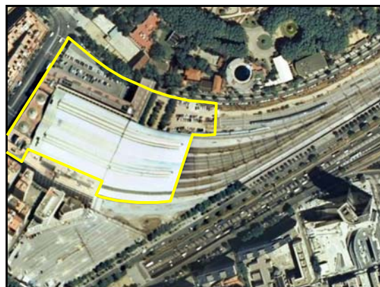
Ejemplos de Estación ferroviaria .